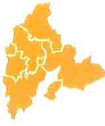
LOKALIZACJA MIASTI GMIN NA TERENIE POWIATU