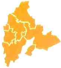
LOKALIZACJA MIAST I GMIN NA TERENIE POWIATU